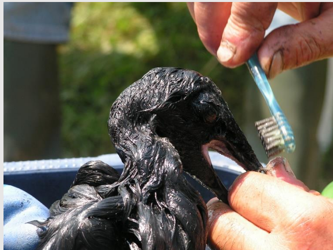
Lavage d'un goéland argenté