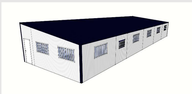
Vue extérieure du bâtiment