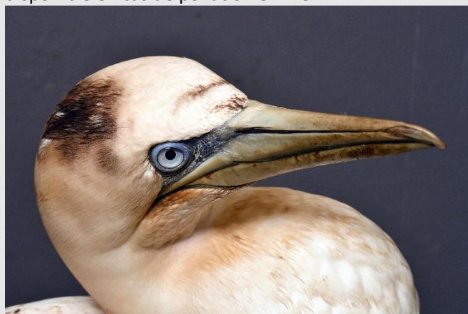
Fou de Bassan mazouté en soins à Volée de piafs