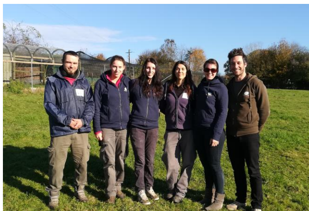
L'équipe (salariés et volontaires en services civiques)