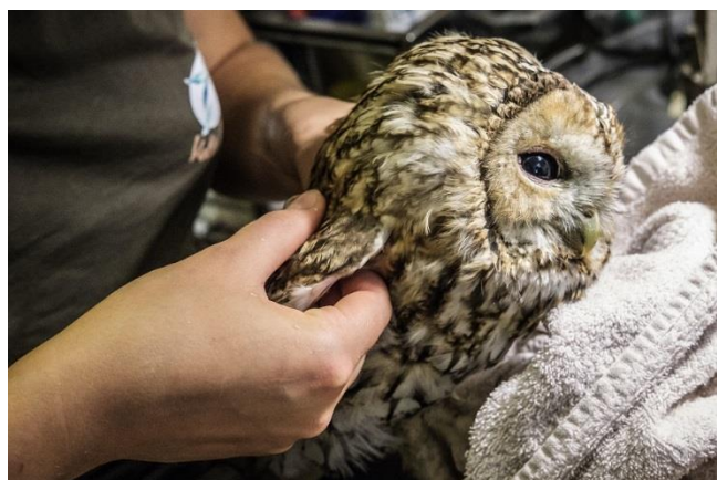
Chouette en soins (animal 360)

A noter également le reportage effectué par Animal 360, durant l'été 2017 (à retrouver sur leur site www.animal360.fr )