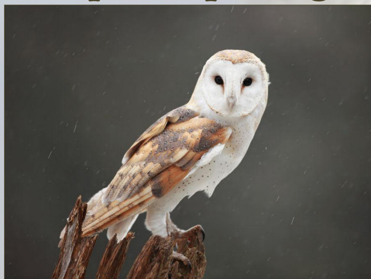
EFFRAIE DES CLOCHERS ☾