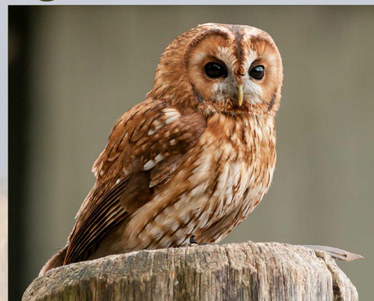
HULOTTE ☀ ☾

L : 21 à 23 cm E : 54 à 61 cm P : ♂ ≈ 180g ♀ ≈ 200g Âge max : 16 ans 3 à 5 oeufs N : Vieux arbres, murailles, bâtiments