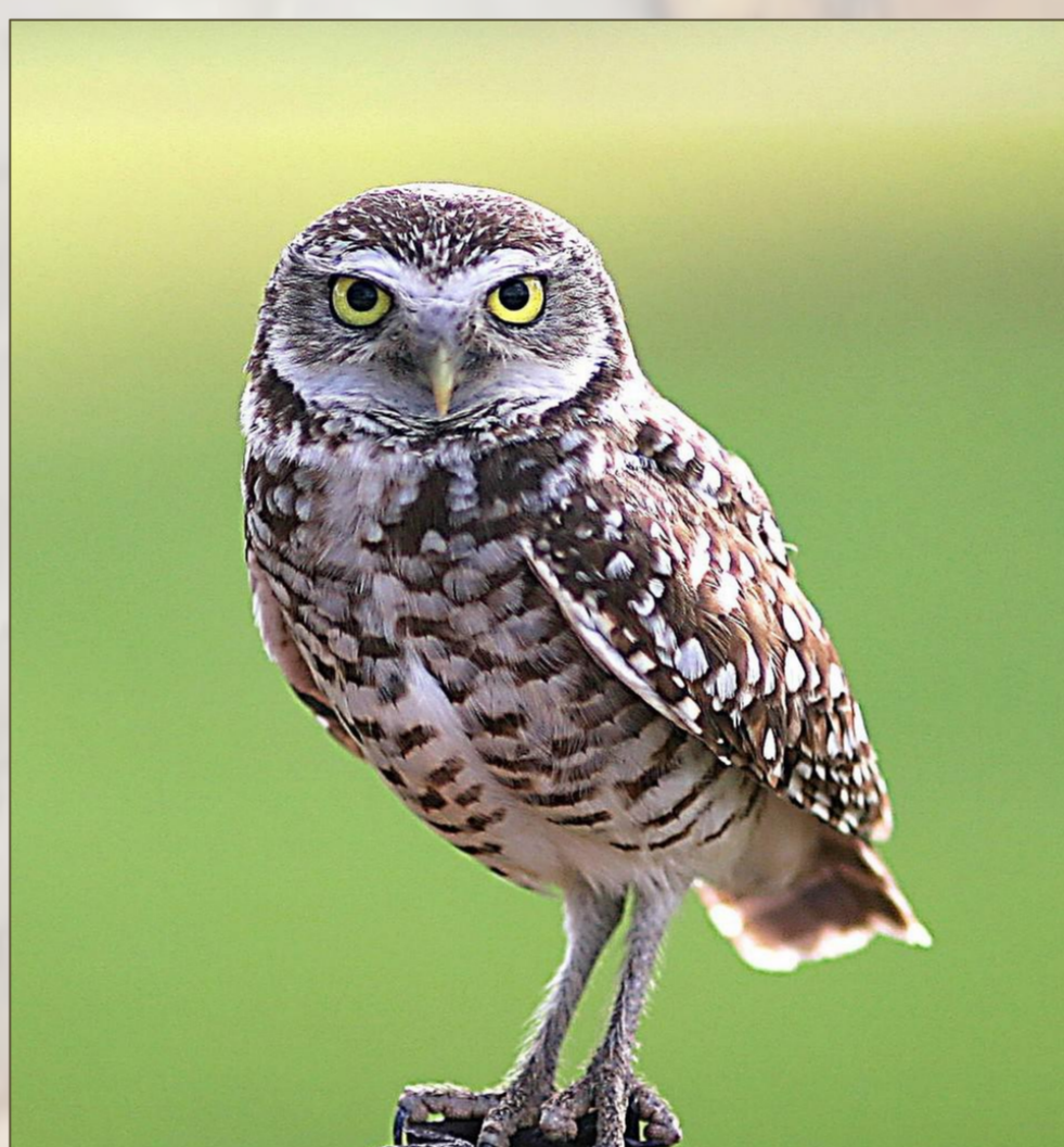
CHEVÊCHE D'ATHÉNA ☀ ☾

Longueur : 33 à 39 cm Envergure : 90 à 98 cm Poids : Mâle ≈ 315g Femelle ≈ 340g Âge maximal : 22 ans Nichées : x2 ; 19 jeunes Nidification : Vieilles bâtisses